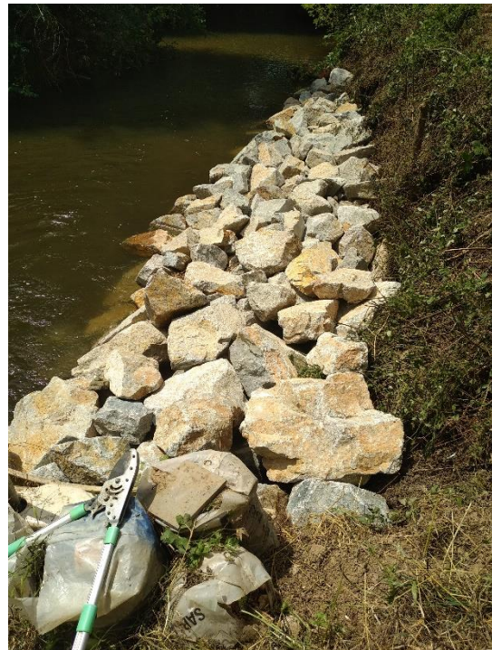
Berge après travaux