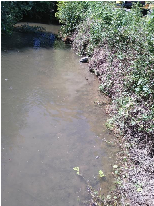
Berge avant travaux

→ Mise en place d'une protection de berge (linéaire de berge de 9.60 m et environ 1.50 m de large)