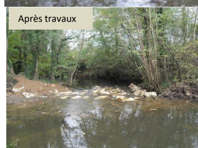
Suppression de l'ouvrage et création d'un radier