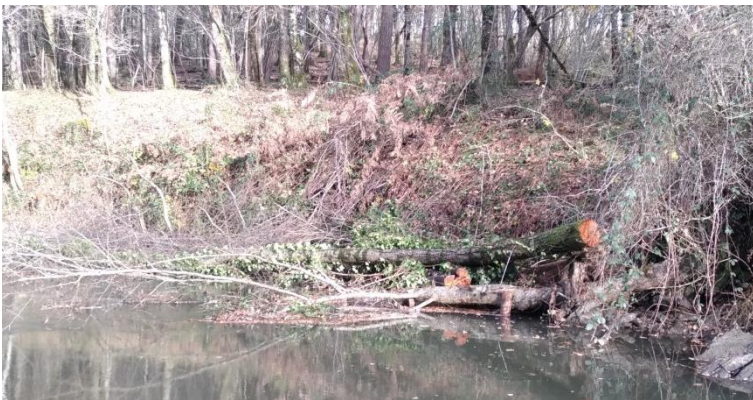
Vu d'un arbre câblé