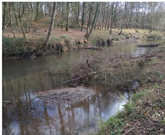
Vu des banquettes