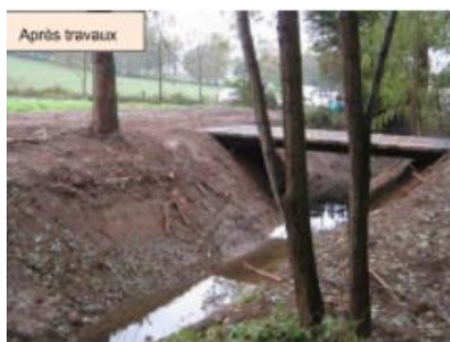
Suppression de l'ancienne buse et création d'une passerelle