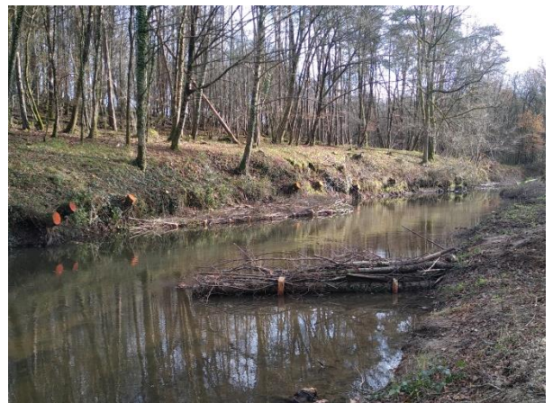
Vu d'un épis végétal